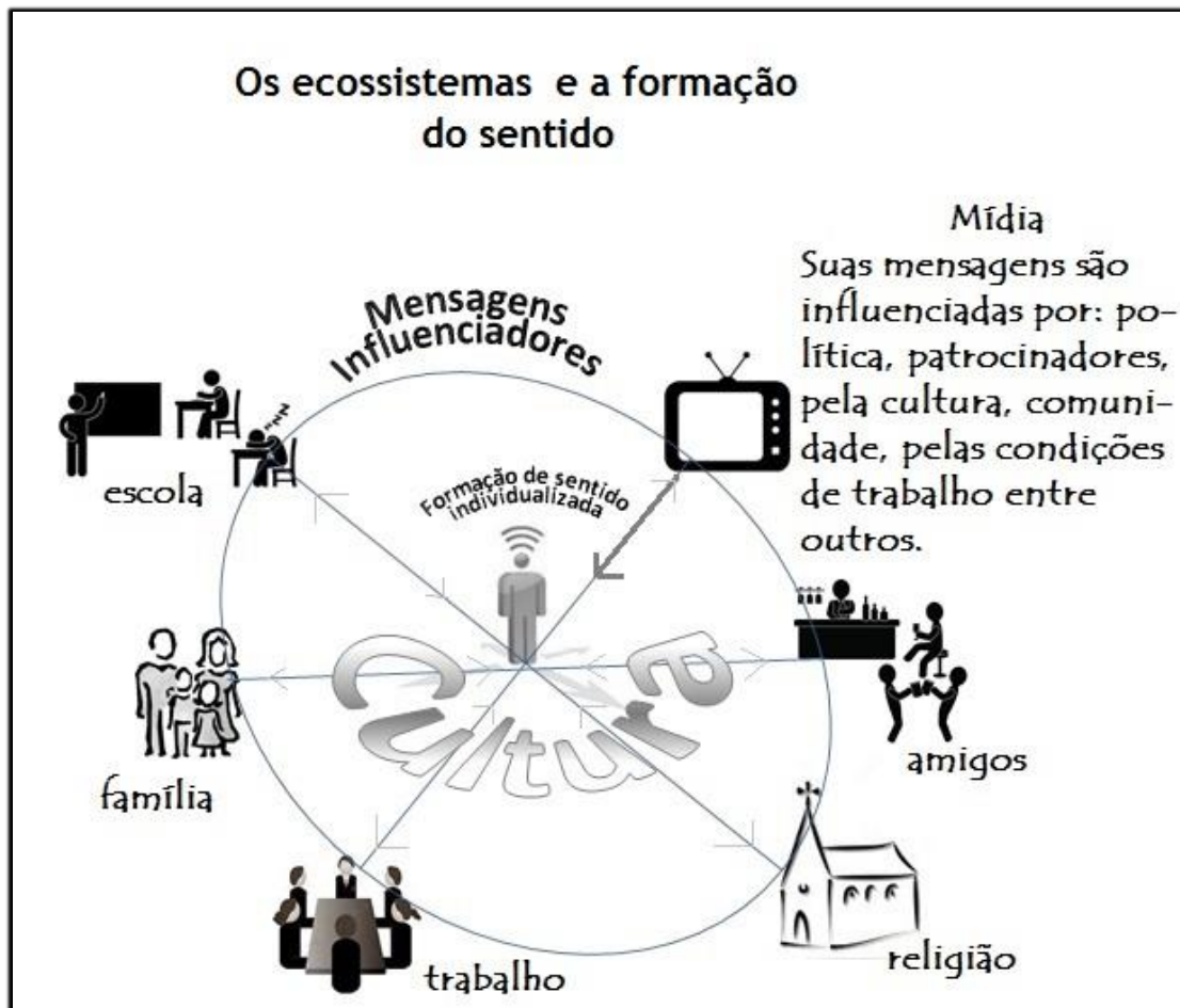
Figura 2 - Ecossistemas e formação do sentido